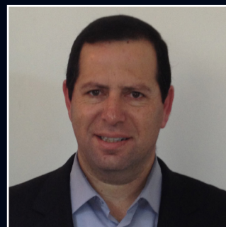
אמיר שי דואר ישראל המגזר הציבורי